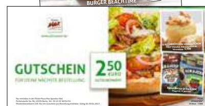
Postkarten & Gutscheine

Bewerben kannst du dein Onlineangebot beispielsweise durch Newsletter oder Online-Coupons. Zu weiteren Möglichkeiten der neuen Medien beraten wir dich gerne und bieten dir Gestaltungsmuster an, auf die du zugreifen kannst.